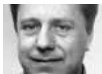
Martin Jakob Centre for Energy Policy and Economics (Cepe) de l'École polytechnique fédérale de Zurich (EPFZ)